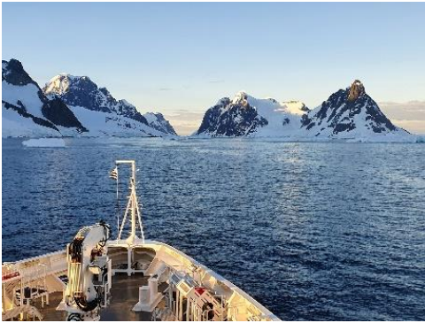
Voyage initiatique, résidence en antarctique

J'ai commencé à écrire avant de savoir écrire. Assise à mon petit bureau, à côté du grand bureau de mon père, avec un feutre noir, j'essayais de reproduire la musique familière de son stylo à plume sur la feuille. Le rythme. Nerveux. Les points avec les silences. Les mots rayés dans des soupirs.